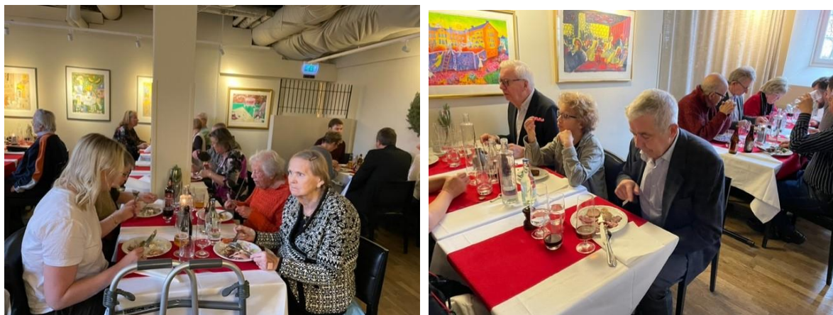
På bilderna syns några av deltagarna i den luftigt möblerade lokalen.

Söndagen den 27 november träffades vi medlemmar på Långholmen för att äta och gotta oss i ett mycket gediget Julbord. Som vanligt var det mycket gott att plocka på tallriken, både från sillbordet och det kalla och varma. Och sedan avslutade man med ost, kex och godis i olika former och smaker. Alla var mycket nöjda och belåtna, och samtidigt passade vi på att vi önska varandra en God Jul