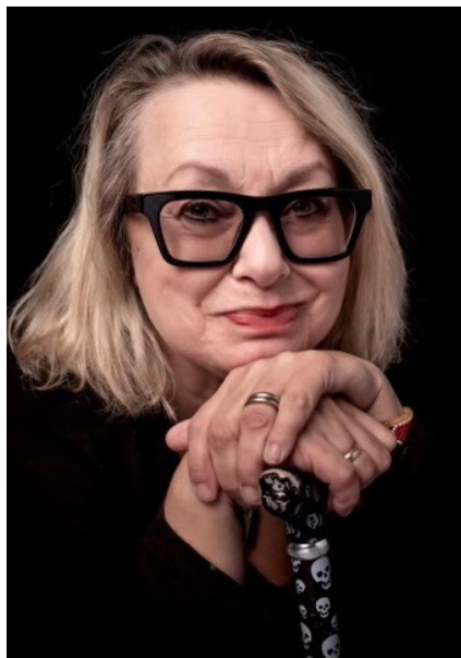
Louise Hoffsten, sångerska och poet

Välkommen lördagen den 29 mars, Hotell Scandic Crown, Polhemsplatsen 3, Göteborg. Ligger vid Centralstationen. Från kl.10.00 serverar vi kaffe och en smörgås. Årsmötet startar kl. 11.00.